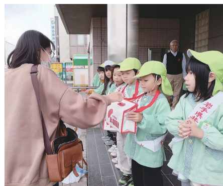
常安寺保育園のみなさん