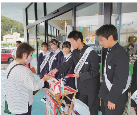
宮古市立花輪中学校のみなさん