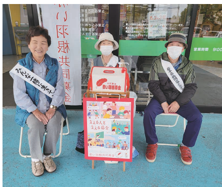
宮古市老人クラブ連合会 宮古市身体障害者福祉会のみなさん