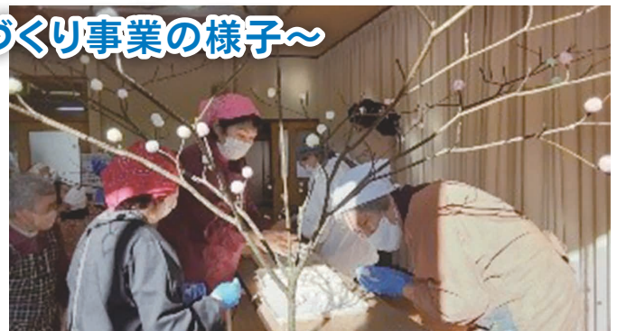
門馬地域自治振興協議会 『世代間交流事業みずき団子・餅つき』