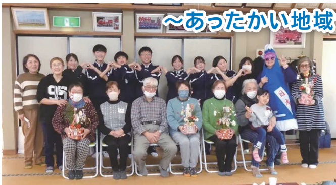
宮古西中学校 『門松づくりボランティア』