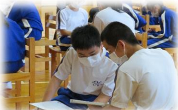
『ボランティア講座』 (新里中)