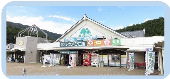
道の駅「やまびこ館」